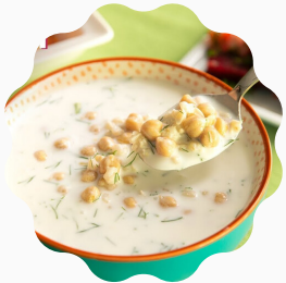
AYRAN AŞI ÇORBASI